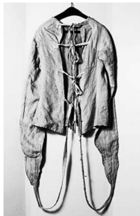
Zwangsjacke, 19. Jahrhundert