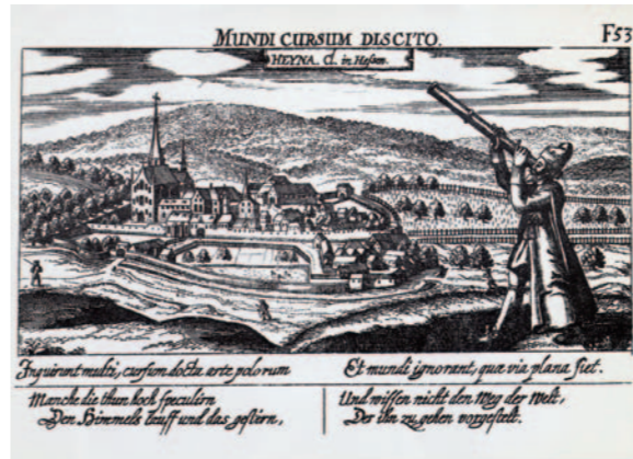
Die Hainaer Kirche mit dem neuen Turm aus dem 17. Jahrhundert, Postkarte