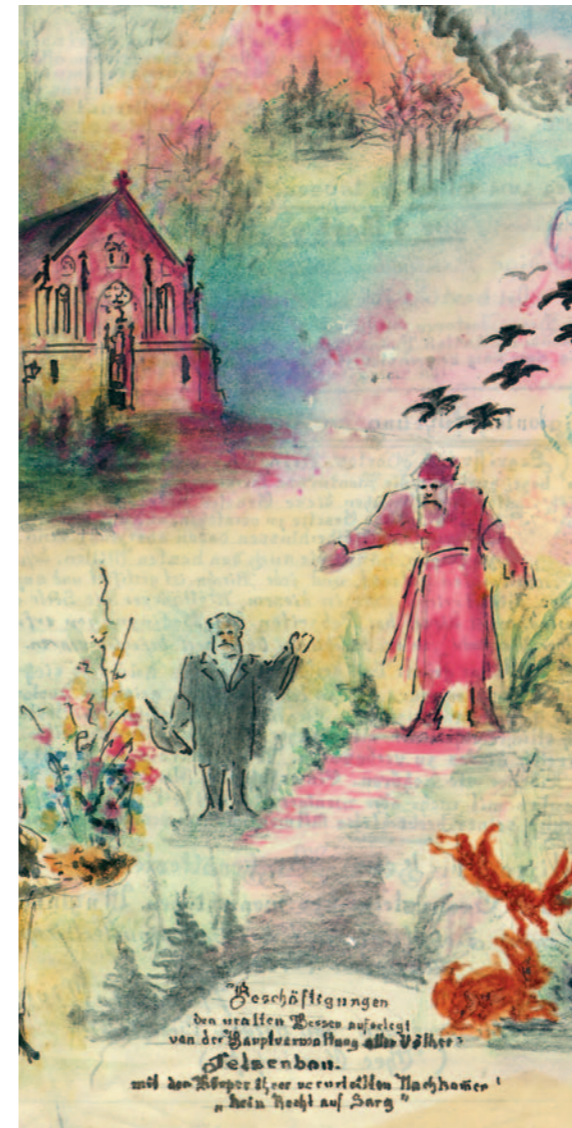
Das Landeshospital Haina, Gemälde eines Hainer Patienten um 1900

Ausstellung, Bibliothek und Archiv zur Hospital- und Krankenhausgeschichte im Zentrum für Soziale Psychiatrie Haina (Kloster)