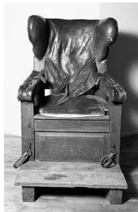
Zwangsstuhl, 19. Jahrhundert